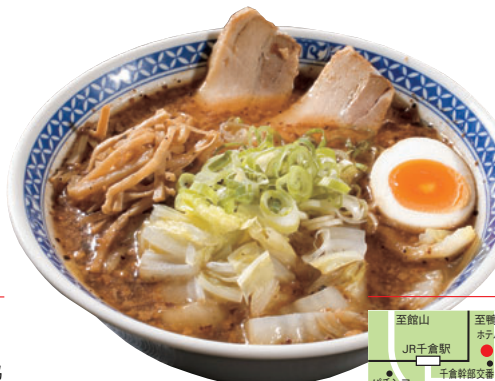
焦がしニンニクラーメン(醤油塩) 880円

丹念にローストされた最高級のニンニク油が香る!! 一度食べたらやみつきになる自慢の一品。やわらかチャーシューや、煮玉子、白菜、シャキシャキメンマが絶妙のハーモニーを奏でます。おすすめメニュー 野菜たっぷりメン…900円 極旨ラーメン…900円 焼き餃子(6ヶ)…490円