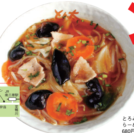
とろみ醤油らーめん 680円