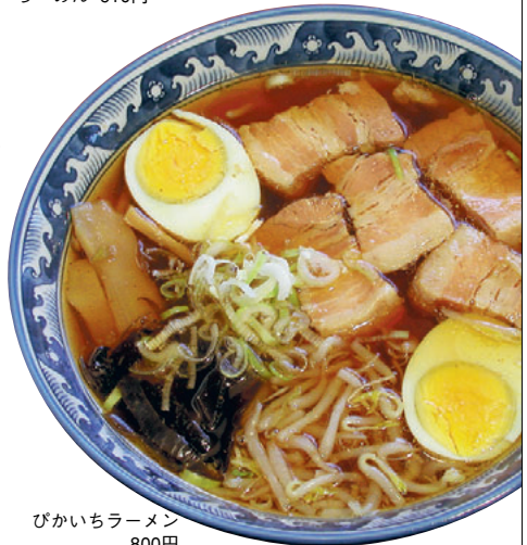
ぴかいちラーメン 800円